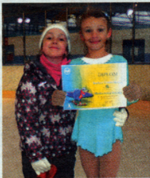
Dorotka a Barborka

Obe mladé Zvolenčanky sa už pripravujú na ďalšie preteky, ktoré ich koncom decembra čakajú v Nitre (Veľká